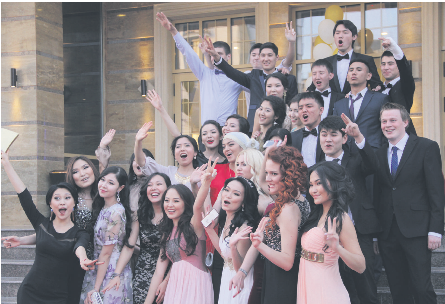
Donkey Bridge (Juniors' Ball 2015)